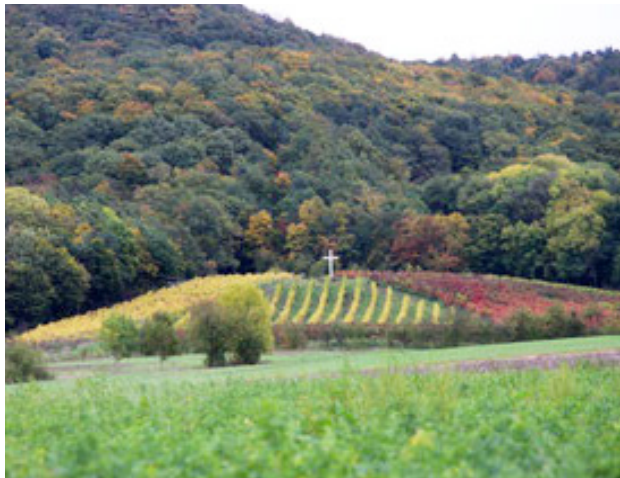
Small is beautiful – der Kirchschnöbacher Mariengarten

Aus diesem Grund haben wir beschlossen, den besonderen Reiz und den Wert dieses heilen Stückchen Erde und intakten Lebensraums Weinberg zu unterschiedlichen Jahreszeiten erlebbar zu machen.