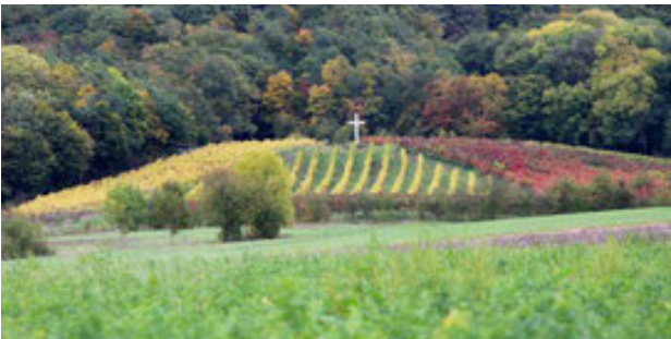
Small is beautiful – der Kirchschnöbcher Mariengarten